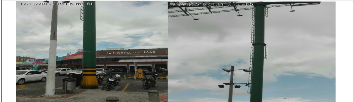
Foto No. 3 y 4: Detalles de la base y del mastil de la valla tubular, en buenas condiciones y estable, instalada en la Av. Carrera 45 No. 183A-86 (dirección registrada) y/o Avenida 13 No. 184-00 (dirección catastral), orientación Oeste-Este .