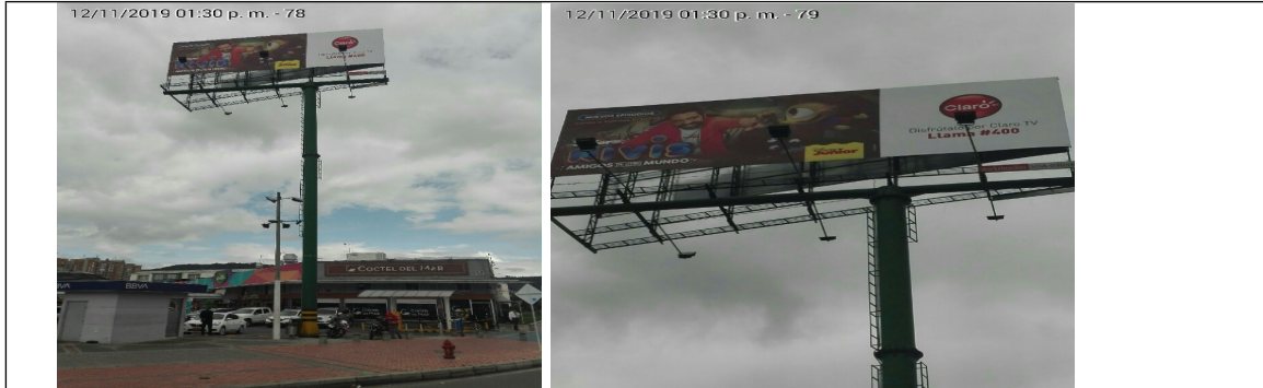
Foto No.1 y 2: Vista panorámica del predio, del panel y de la estructura de la valla, ubicada en la Av. Carrera 45 No. 183A-86 (dirección registrada) y/o Avenida 13 No. 184-00 (dirección catastral), orientación Oeste-Este .

ALCALDÍA MAYOR DE BOGOTÁ D.C. SECRETARÍA DE AMBIENTE